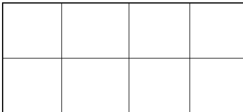
Рис. 1. Деление листа при формате в \frac{1}{8} долю (лист согнули 3 раза)

Знаменатель дроби представляет собой произведение двух чисел, показывающих, на сколько равных частей разделен лист по ширине и по длине для образования данной страницы и, следовательно, данного формата издания. Наиболее распространены следующие доли: \frac{1}{8} , \frac{1}{16} , \frac{1}{32} .